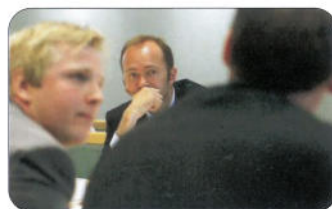
En lyttende og interessert nærings- og handelsminister Trond Giske.